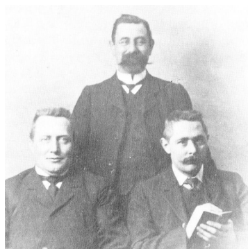
Directie van Poels & Co Antwerpen.

In 1909 wordt de zetel van Poels en Co. overgeplaatst naar een kantoorpand in het centrum van Antwerpen. Vanaf 1910 zich nog uitsluitend af in Antwerpen. Poels en Co. evolueert in deze tijd meer en meer tot een familieonderneming, geleid door en in het bezit van de familie Poels. Tot en de eerste wereldoorlog blijft de firma zich toeleggen op de import van schapen en later hoornvee via de Antwerpse haven. De afzet richt zich op België en Frankrijk en incidenteel op Engeland. Terwijl de handen in Duitse schapen geleidelijk terugloopt, neemt die uit Denemarken en Argentinië in omvang toe.